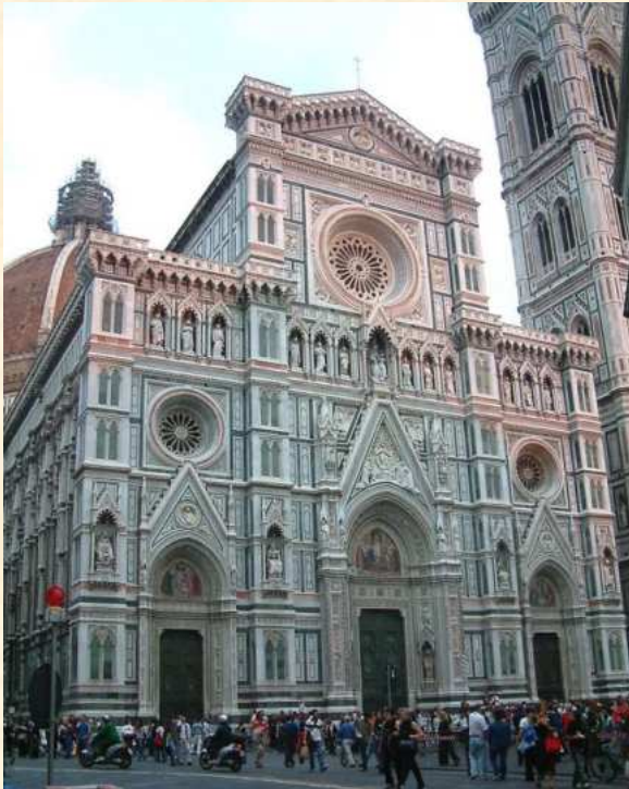
Katedra Santa Maria del Fiore