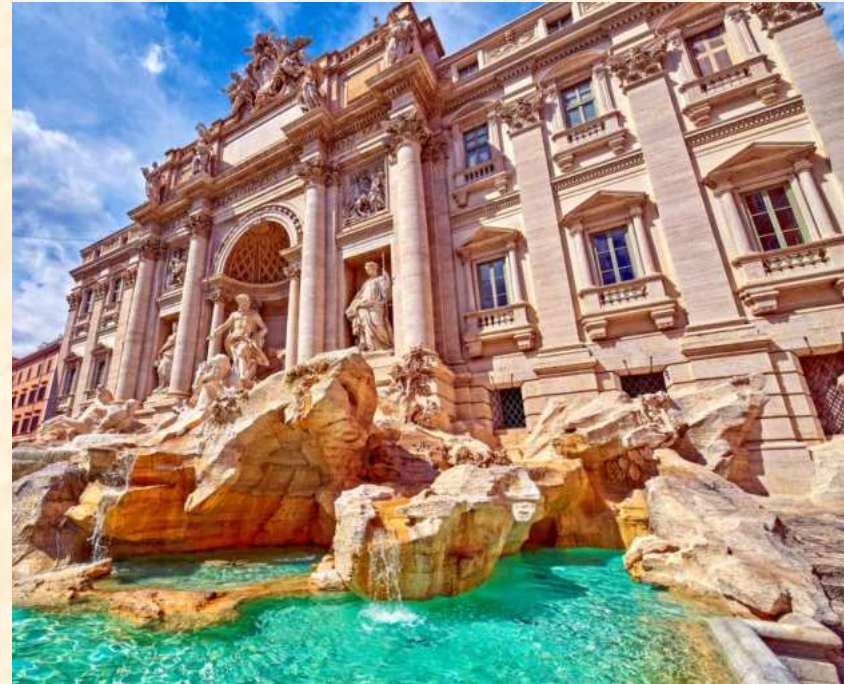
Fontanna di Trevi