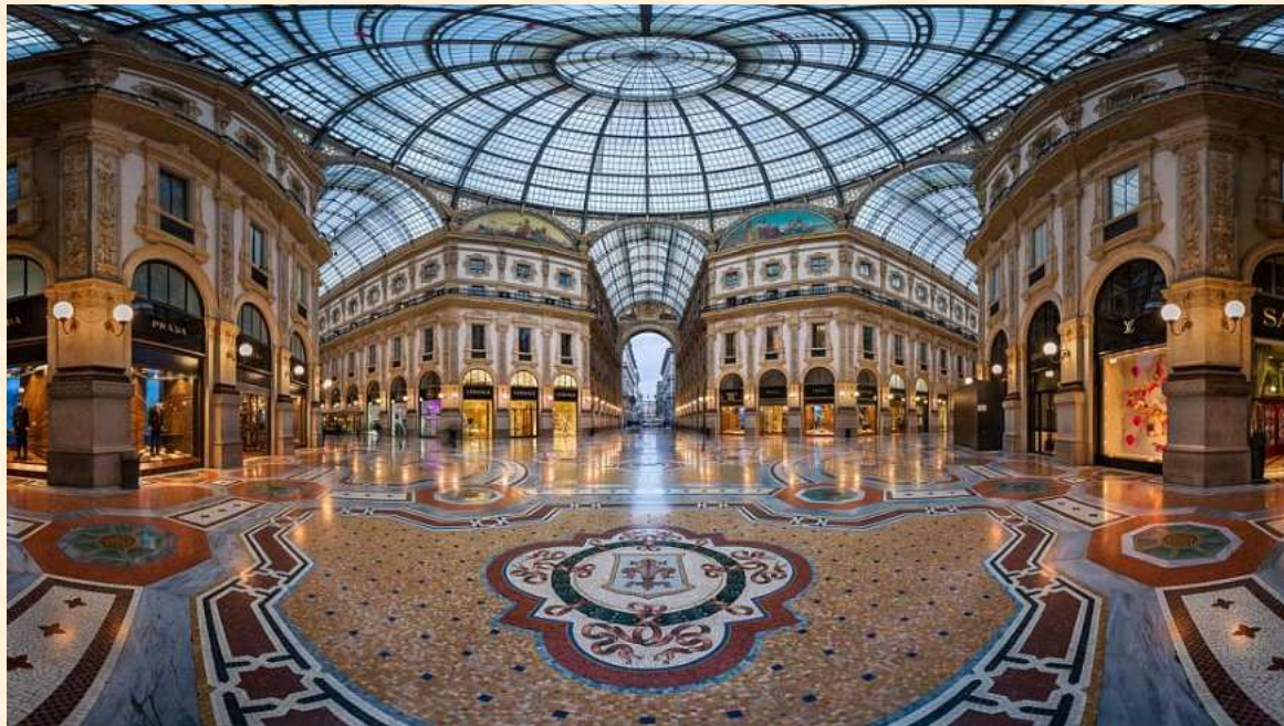
Galeria Victoria Emanuela II