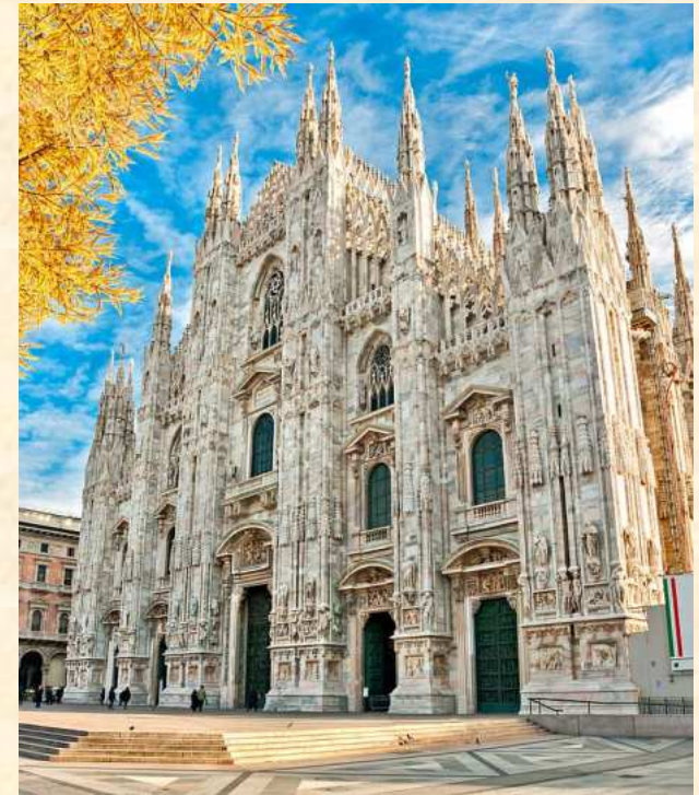
Katedra Duomo di Milano